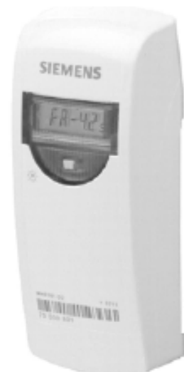
Elektroniczny dwuczujnikowy podzielnik kosztów ogrzewania WHE502

Prosimy o zrozumienie, że podzielnik, nawet elektroniczny, nie jest licznikiem, lecz urządzeniem pomocniczym, za pomocą którego dokonuje się podziału kosztów ogrzewania, proporcjonalnie do pobranego ciepła przez każdy grzejnik. Nie można zatem bezpośrednio określić wysokości rachunku za ogrzewanie na podstawie tylko wskazań podzielników w swoim mieszkaniu. Dopiero znajomość wskazań u wszystkich lokatorów, a także parametrów poszczególnych grzejników w powiązaniu z określeniem współczynników usytuowania mieszkań w budynku, pozwala na precyzyjne określenie indywidualnych kosztów zużycia ciepła danego mieszkania.