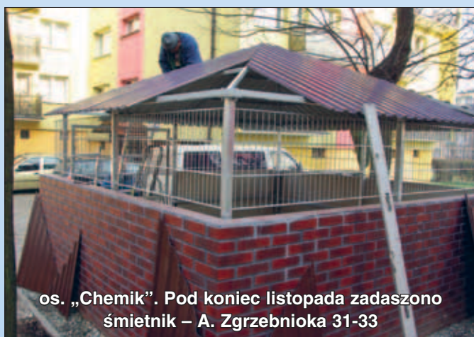
os. „Chemik”. Pod koniec listopada zadaszono śmietnik – A. Zgrzebnioła 31-33