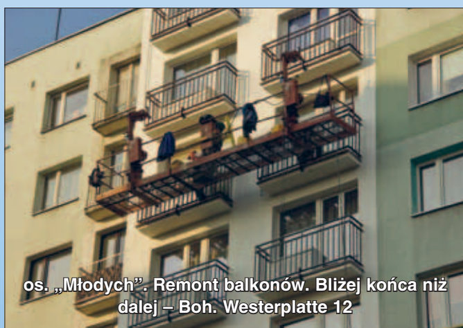
os. „Młodych”. Remont balkonów. Blżej końca niż dalej – Boh. Westerplatte 12