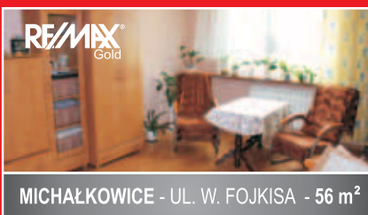
MICHAŁKOWICE - UL. W. FOJKISA - 56 m 2

szczegóły pod numerem telefonu: +48 602 212 096