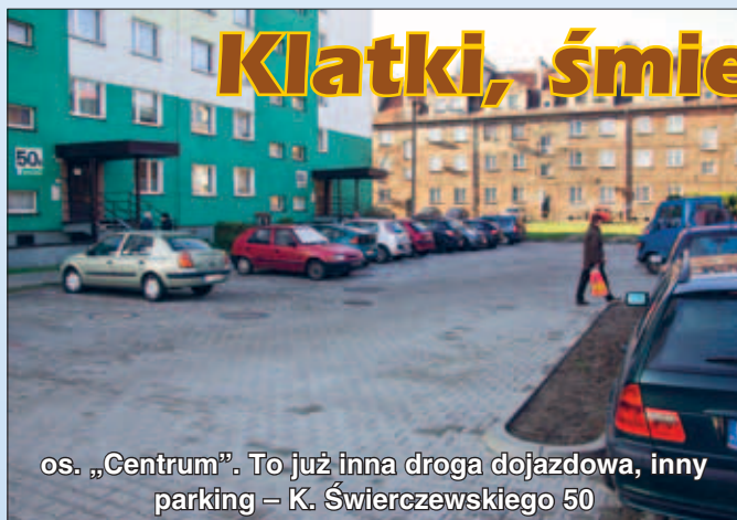
os. „Centrum”. To już inna droga dojazdu, inny parking – K. Świerczewskiego 50