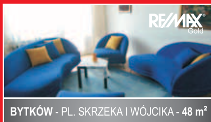
BYTKÓW - PL. SKRZEKA I WÓJCIKA - 48 m 2