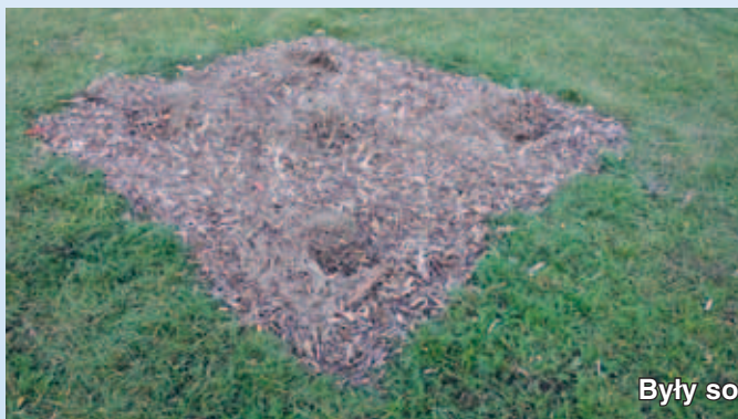
Były sobie krzewy