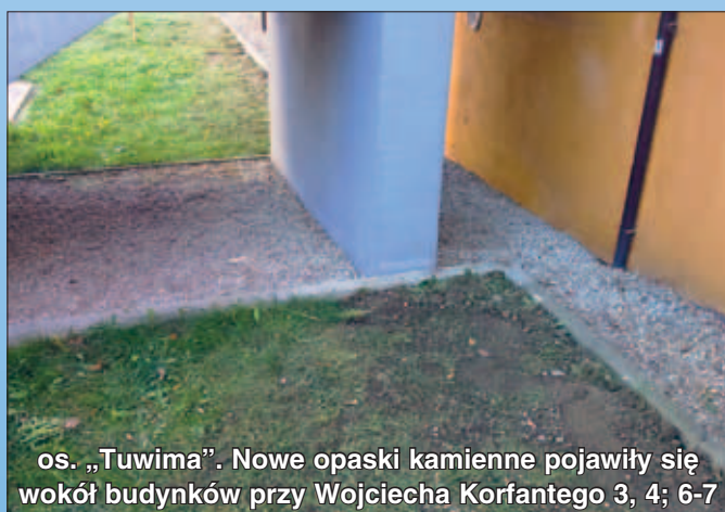
os. „Tuwima”. Nowe opaski kamienne pojawiły się wokół budynków przy Wojciecha Korfańskiego 3, 4; 6-7