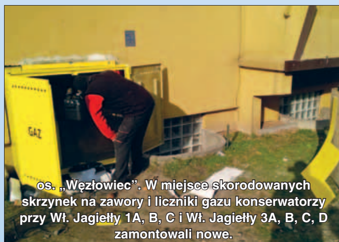
os. „Węzłowiec”. W miejsce skorodowanych skrzynek na zawory i liczniki gazu konserwatorzy przy Wł. Jagiełły 1A, B, C i Wł. Jagiełły 3A, B, C, D zamontowali nowe.