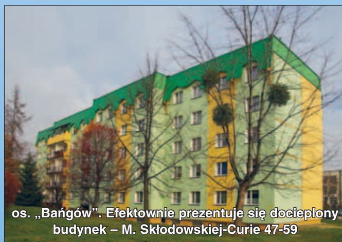
os. „Bańgów”. Efektownie prezentuje się docieplony budynek – M. Skłodowskiej-Curie 47-59