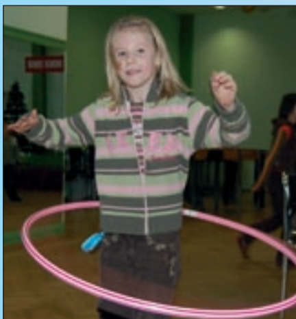
Hula-hop i już.

Uczestnicy zajęć mogli tam przychodzić od godziny 9.00 do 14.00. Już od pierwszego dnia były wspólne zabawy, wyjścia w plener, konkursy. Dzieci miały okazję wyżyć się plastycznie, potańczyć i, co dla wielu z nich najważniejsze, zawrzeć nowe przyjaźnie i znajomości. Kilkudziesięciu uczestników nie kryło zadowolenia ze wspólnie spędzanego czasu. Wielu z nich podkreślało, że podczas ostatnich dni w szkole przed feriami odliczało dni, kiedy będą mogli przyjść na półkolonie, bo tutaj czują się jak w domu. Warto podkreślić, że w grupie były dzieci w różnym wieku – od 6 do 14 lat. Nikomu to