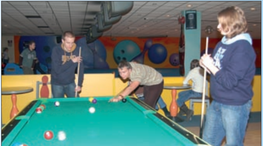
„RENOMA” to nie tylko bowling.

- Wraz z moimi kolegami graliśmy dzisiaj trzy godziny w bowlingu. Ale chętnie i często korzystamy też z bilarda. Chociaż koledzy są z Katowic, to lubią przyjeżdżać do „Renomy”, gdyż jest tu o wiele taniej. Fajna jest też atmosfera. Najczęściej czas spędzamy tu w ferie zimowe i letnie wakacje, gdyż w trakcie roku szkolnego nie mamy go zbyt wiele. Wtedy pochłaniają nas zajęcia związane ze sportem i nauką, a szczególnie nauką języków ob-