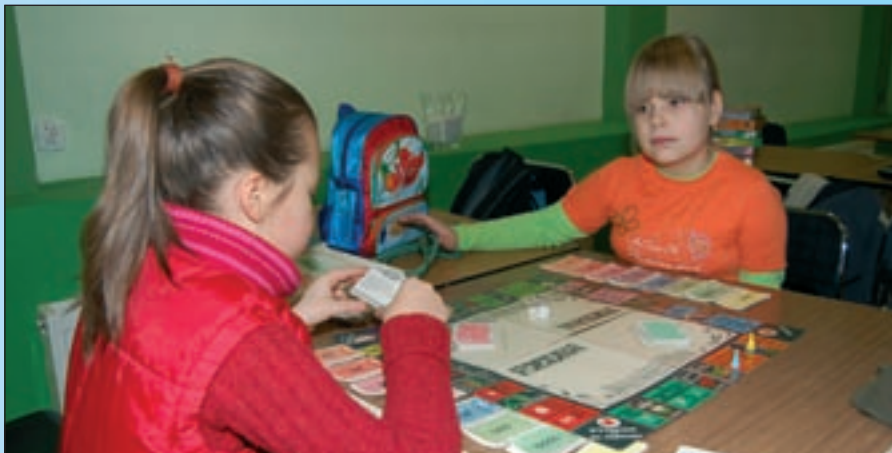
Czy niewinna zabawa to początek kariery w biznesie?

Spśród kilkunastu konkursów przeprowadzonych podczas zajęć na półkoloniach odnotowaliśmy wyniki kilku.