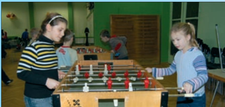
Piłkarzyki to gra nie tylko dla chłopców.

jednak nie przeszkadzało, starsi potrafili zaopiekować się młodszymi.