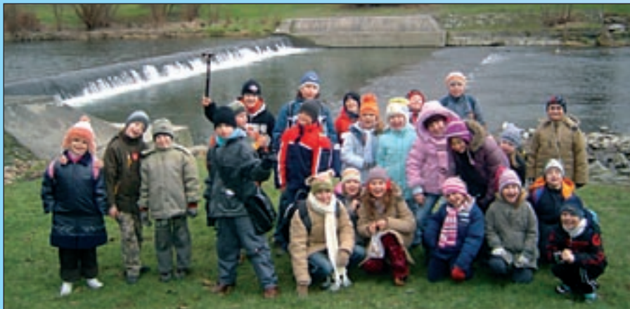
Najwięcej zadowolenia dostarczają wycieczki. One też najdłużej pozostaną w pamięci.

D zieci, które nigdzie nie wyjechały podczas styczniowej przerwy w nauce, nie miały czego żałować. Po raz kolejny mogły skorzystać z bogatej oferty, jaką specjalnie dla nich na ten czas przygotowało kierownictwo Domu Kultury „Chemik”. Co prawda pogoda w tym okresie była nijaka, ale paradoksalnie uczestnicy tych zajęć przez dwa tygodnie nie narzekali na nudę i brak pozytywnych wrażeń. Szefostwo ośrodka jeszcze raz pokazało, że za niewielkie pieniądze można zaproponować dzieciom moc atrakcji i oderwać je od komputera i telewizora.