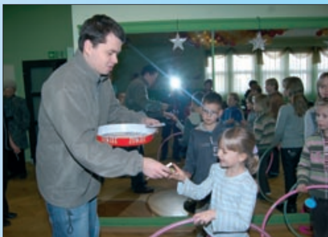
Każdy konkurs zwieńczyły nagrody.

W kolejności zajętych miejsc najlepszymi byli: