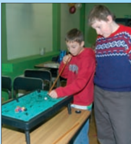
Zanim się przejdzie na duży stół...