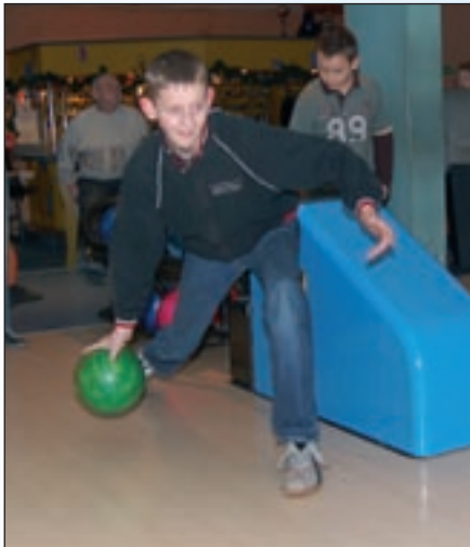
Jak będzie tym razem?

przyciąga tu nie tylko pasjonatów kręgli z Siemianowic Śląskich, ale też z innych miast. Sympatycy „RENOMY” przychodzą tutaj nie tylko dla bowlingu. Dużym powodzeniem cieszy się również dart, cymbergaj, piłkarzyki i bilard.