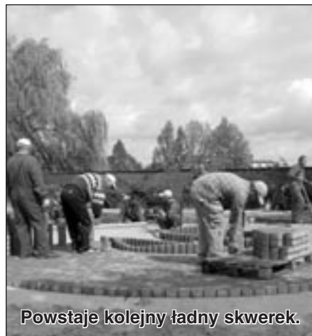
Powstaje kolejny ładny skwerek.

leni. W miejsce starych, pylących topól, są nasadzone nowe szlachetne gatunki drzew. Uważam jednak, że proces ten należy przyspieszyć, aby zadbać o dalszą równowagę ekologiczną.