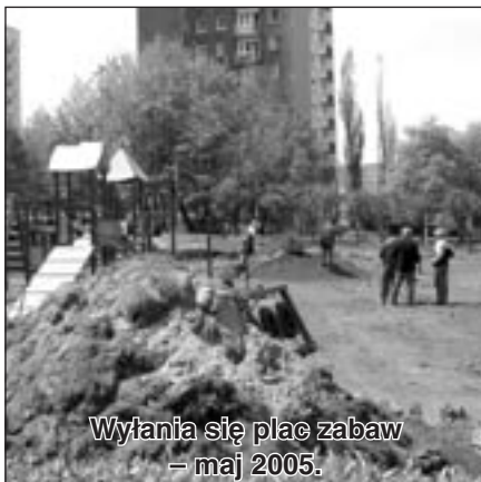
Wyłania się plac zabaw – maj 2005.