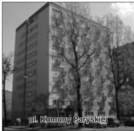
ul. Komuny Paryskiej