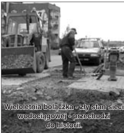
Wieloletnia bolączka - zły stan sieci wodociągowej - przechodzi do historii.