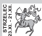
STRZELEC 23.XI. - 21.XII.

Pan Skorpion bardzo ceni sobie rodzinę i w ogóle życie domowe, bowiem tutaj upatruje spokoju i bezpieczeństwa, których brak mu w działalności zawodowej. Biada jednak, jeśli to poczucie utraci, np. podejrzewa żonę o zdradę.