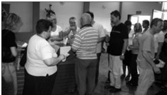
Nazwiska skreślone – głosy do urny.