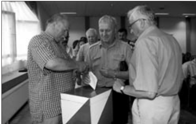
Wybieramy nową Radę Nadzorczą: WZ – część VI – os. „Michałkowice”.