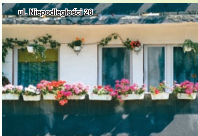
ul. Niepodległości 26