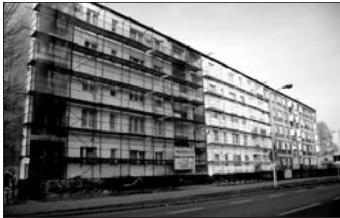
Szanujmy to co wykonano – nie będziemy się wstydzić.

Temu problemowi należy nadać odpowiednią rangę i znaczenie. Ten problem musi zdobyć uznanie Parlamentu i Rządu, nie rozwiążą go demagogiczne i populistyczne hasła niektórych grup politycznych. Zamiast brać się za aktywizację budownictwa mieszkaniowego ciągle miesza się w ustawach o spółdzielniach mieszkaniowych, bo to nie kosztuje i nie wymaga wysiłku, a jest chwytliwe szczególnie przed każdymi wyborami. Więcej troski o spółdzielczość mieszkaniową wykazuje Episkopat i du-