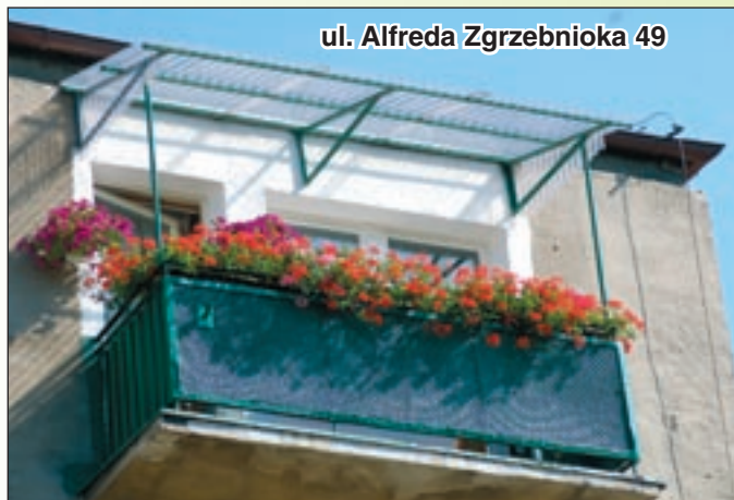
ul. Alfreda Zgrzebnioka 49