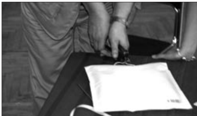
Plombowanie koperty z kartami do głosowania.