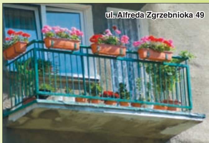
ul. Alfreda Zgrzebnioka 49

ogrodnicze oferują wyjątkowo bogaty wybór roślin ozdobnych urzekających intensywnością kolorów.