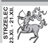
STRZELEC 23.XI. - 21.XII.

Pan Skorpion w miłości bardziej ceni sobie seks niż ładne słówka, ale gdy partnerka tego właśnie oczekuje, potrafi opisać się miłosnymi zwierzeniami. Byle nie za dużo i nie za często, bo to przechodzi jego możliwości.