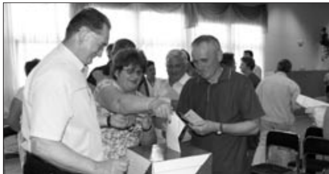
Na wszystkich ZOCz wybrano Rady Osiedli. Ich pełny skład podaliśmy w „MS” 6/2008.

W ich skład weszły zarówno osoby z dużym doświadczeniem społecznym, jak i te, dla których praca w samorządzie osiedlowym będzie nowym wyzwaniem. Zakres obowiązków Rad jest dość szeroki, gdyż obejmuje nie tylko opracowanie budżetu remontowego osiedla, ale także bieżącą kontrolę nad jego wydatkami.