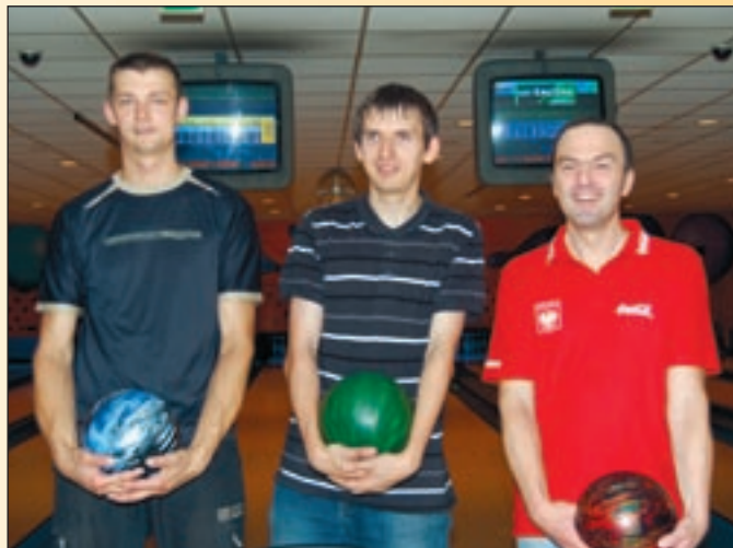
Zwycięzcy „RENOMA CUP”

mi od siebie. Reguły turnieju były jednak nieubłagane i stopniowo odpadali kolejni zawodnicy. – Od kilku lat uczest-