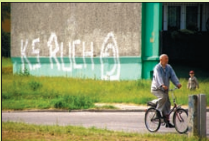
Tym napisem powitano uczestników festynu.

Odrębną kategorią są kradzieże. W tym przypadku złodzieje bezmózgowcy sięgają po mienie, nie bacząc na jakiegokolwiek konsekwencje – w tym