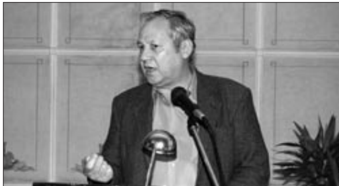
Dyskutowało 9 osób.

tyczących wyprowadzania psów na smyczy i stosowania się kierowców do przepisów ruchu drogowego. Natomiast dalsza część dysku-