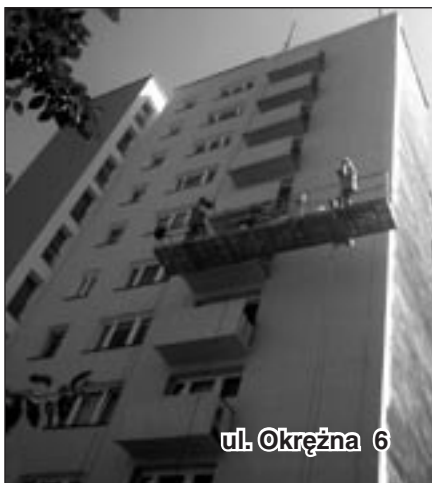
ul. Okrężna 6