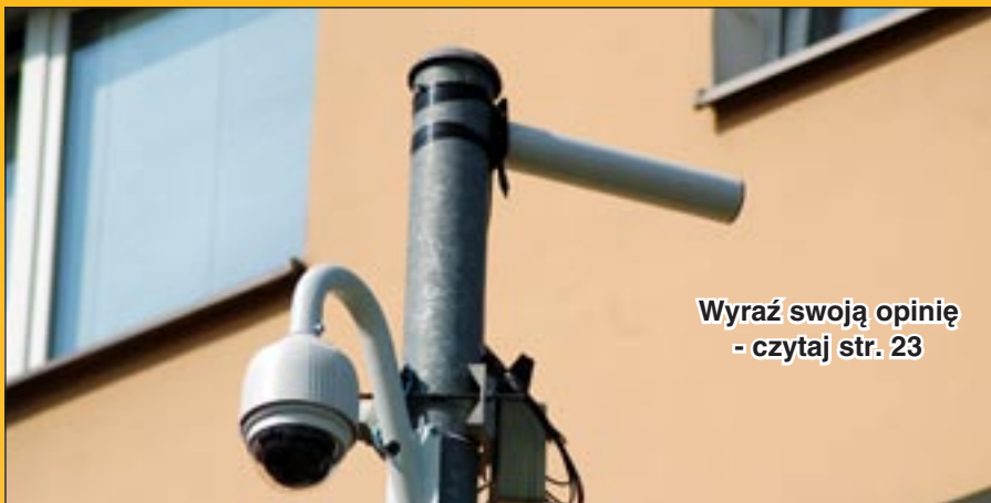
Wyraź swoją opinię - czytaj str. 23