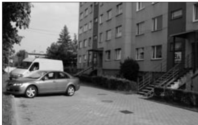
Po wykopach zostało wspomnienie i nowe nawierzchnie – ul. Przyjaźni 8.

segregację śmieci. Roboty wykonywane są w oparciu o niezbędny w takich przypadkach projekt budowlany i wydane na jego podstawie pozwolenie Urzędu Miasta. Nieco inne natomiast prace poprawiające komfort zamieszkałych prowadzono przy ul. Władysława Jagiełły 3. Tam położono bowiem kilkadziesiąt metrów