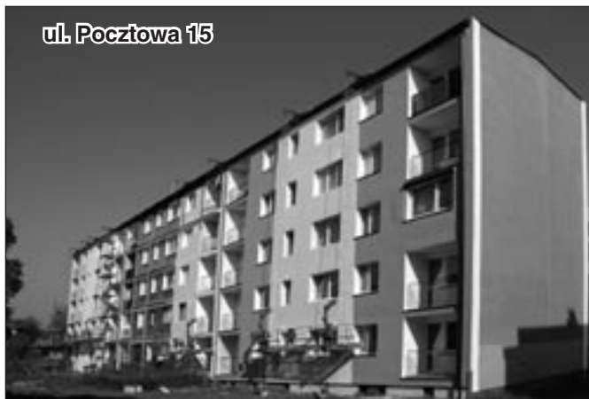
ul. Pocztowa 15

O tym, że prace te przynoszą efekty, mówią chociażby bilanse ciepłe sporządzane co roku przez Zarząd Spółdzielni. Wynika z nich, że zużywamy coraz mniej ciepła, w czym zapewne pomocne są również łagodne zimy. Jednak łaskawość aury to nie wszystko. Ewidentnym jest, że środki finansowe zainwestowane w docieplenia przekładają się na oszczędności energii cieplnej. Jakże to ma znaczenie dla domowych budżetów, wiemy wszyscy, tym bardziej, że ciepło systematycznie drożeje – czego przykład najświeższy mamy w bieżącym numerze - czytaj: Mroząco o ciepło – str. 4-5.