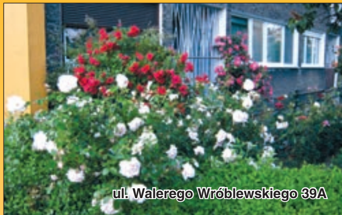
ul. Walerego Wróblewskiego 39A

konają wyboru najładniejszych ogródków i balkonów. Nie będzie on z pewnością łatwy, gdyż z roku na rok przybywa miłośników kwiatów. Trudno bę-