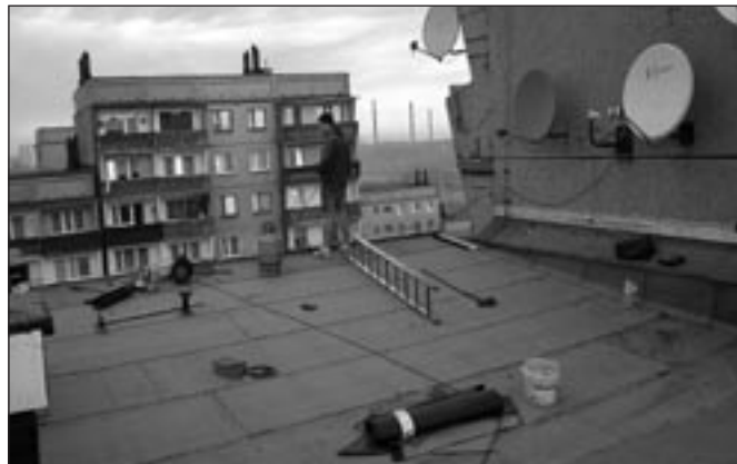
Nowy dach budynku przy Wł. Jagiełły 35 – czyli burze nam nie straszne.