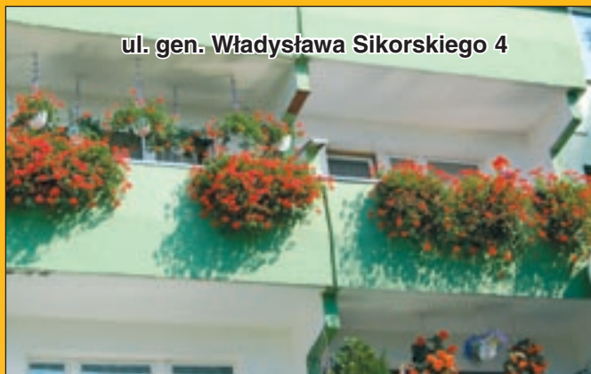
ul. gen. Władysława Sikorskiego 4

gdy nagrodą są pięknie kwitnące rośliny wyhodowane czy wypielęgnowane własnymi rękami. Nie bez znaczenia jest też uznanie sąsiadów chętnie podzi-