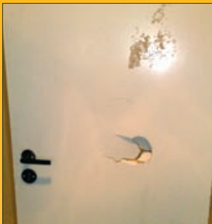
No i komu one przeszkadzały?