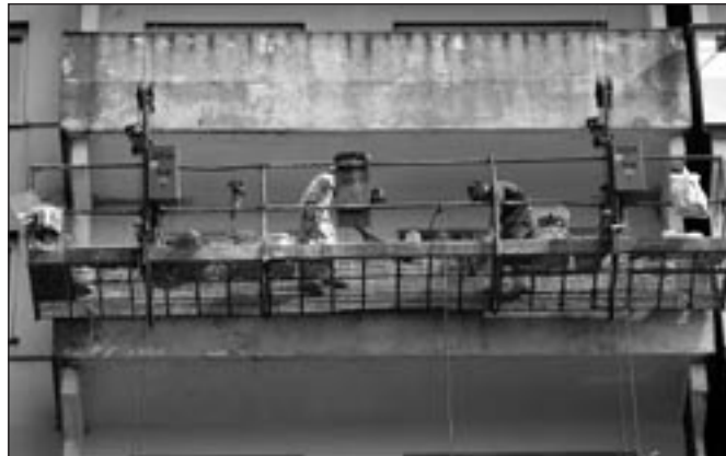
Remont balkonów - osiedle „Młodych”.

stawia nowy chodnik oraz stanowisko dla kontenerów na odpady i pojemniki na kwadratowych nowej nawierzchni asfaltowej, co wyraźnie zmieniło dotychczas-