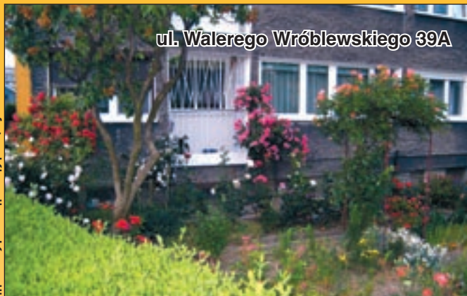
ul. Walerego Wróblewskiego 39A

wiających efekt kilkutygodniowej pracy. Szczególnie więc cieszą nas listy czy informacje telefoniczne wskazujące na ładne balkony, czy pięknie utrzymane ogródki a docierające do redakcji bezpośrednio od zamieszkałych. Te drobne gesty są wspaniałym podziękowaniem dla osiedlowych ogrodników.