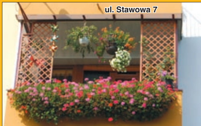
ul. Stawowa 7

Konkursu. Już wkrótce specjalne komisje składające się z pracowników administracji i członków Rad Osiedli do-