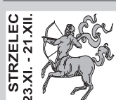
STRZELEC 23.XI. - 21.XII.

Skorpiony należą do znaków łatwo ulegających depresji i zawsze winią okoliczności, czy ludzi z najbliższego otoczenia. Z pomocy lekarza lub psychologa korzystają rzadko. Depresja szybko u nich mija.