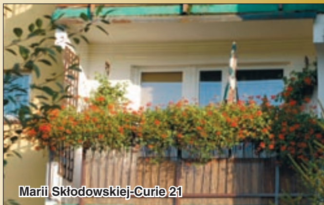
Marii Skłodowskiej-Curie 21

Ponadto, cieszy fakt, że w tym roku przybyły kolejne ogródki przydomowe. Niejednokrotnie przekonaaliśmy się o tym, że lokatorzy podchodzą do ich pielęgnacji z ogromną pasją. Wszystkie te działania podejmowane często w spontanicznie znacząco przyczyniają się do poprawy estetyki budynków.