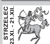
STRZELEC 23.XI. - 21.XII.

Skorpiony zazwyczaj popierają kandydatów na państwowe stanowiska, którzy potrafią walczyć, są skuteczni w działaniu. Mogą nawet nie przebierać w środkach, bo dla Skorpionów liczy się przede wszystkim wygrana walka.