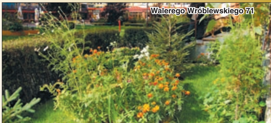
Walerego Wróblewskiego 71

Wkrótce przed nami spotkanie z laureatami Zielonego Konkursu. Redakcja „MS” dziękuje pracownikom administracji oraz przedstawicielom Rad Osiedlowych za pomoc w wyłonieniu tegorocz-