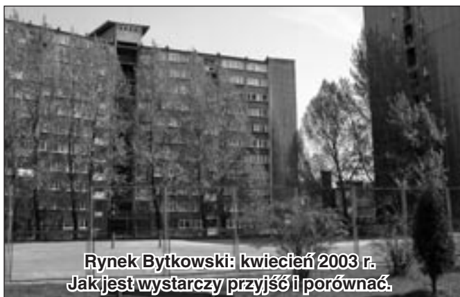
Rynek Bytkowski: kwiecień 2003 r. Jak jest wystarczy przyjść i porównać.