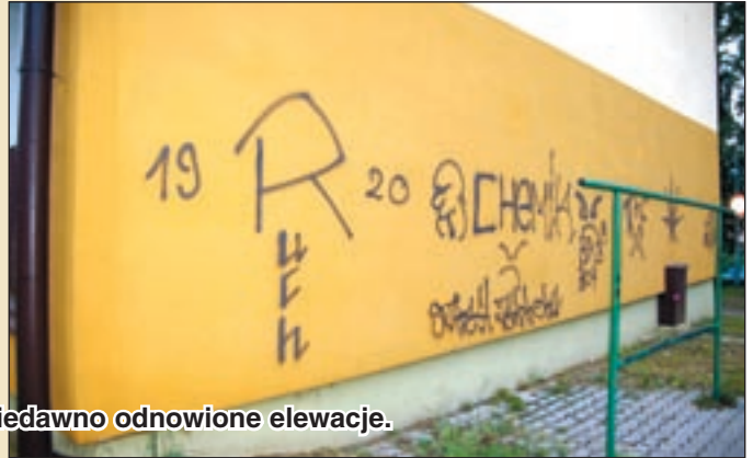
Os. „ChemiK”: Tak wyglądają niedawno odnowione elewacje.

niszczony. To niszczenie zaś przekłada się na wyciekanie pieniędzy z naszych kieszeni, pieniądze wydatkowane na bezsensowne naprawy.