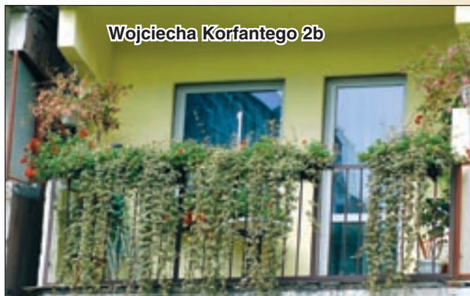
Wojciecha Korfantego 2b