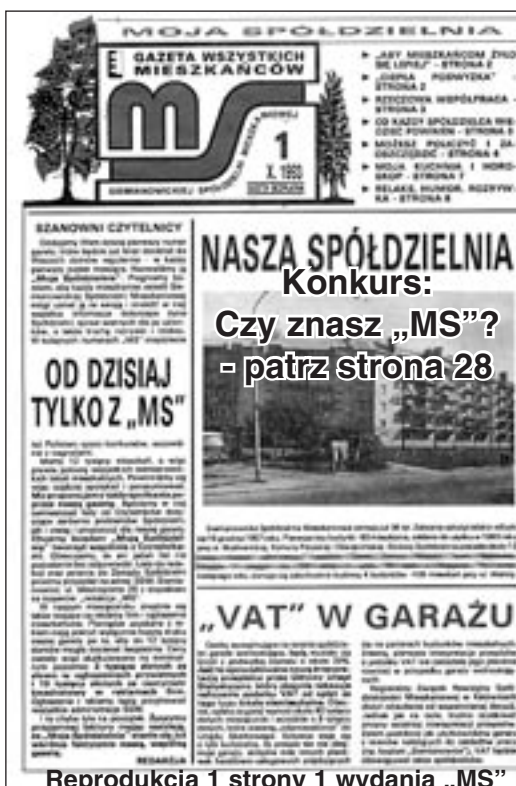
Reprodukcja 1 strony 1 wydania „MS”

Na stronie 32 przedstawiamy sześć z 360 okładek dotychczasowych wydań „MS”. Redakcja „MS”