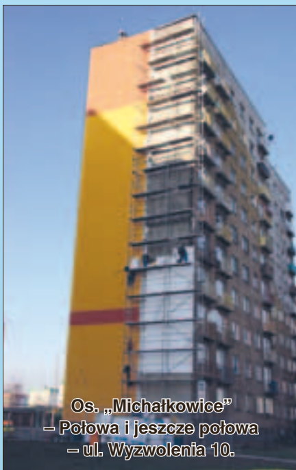
Os. „Michałkowice” – Połowa i jeszcze połowa – ul. Wyzwolenia 10.

roboty dociepleniowe balkonów przy ul. Grunwaldzkiej 5A – to ostatnia z sześciu klatek. Pod koniec listopada