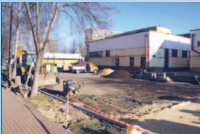
Os. „Tuwima” – W trakcie prac nad nową drogą w rejonie ul. Wojciecha Korfanteego 3-4.

Na koniec listopada administracja nie notowała żadnych uwag dotyczą-