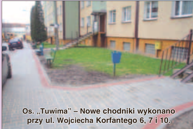
Os. „Tuwima” – Nowe chodniki wykonano przy ul. Wojciecha Korfanteo 6, 7 i 10.

ja w piwnicach i zalewa je fekaliami. Ostatnio znów dała o sobie znać. Mimo regularnego oczyszczania, zdarzają się wciąż awarie. Urząd Miasta na razie ma tylko w planach jej modernizację. Kiedy ona nastąpi, dokładnie nie wiadomo.