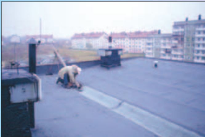
Os. „Węzłowiec” – Zakończono remont dachu nad całym budynkiem ul. Władysława Jagiełły 25A, B, C, D .