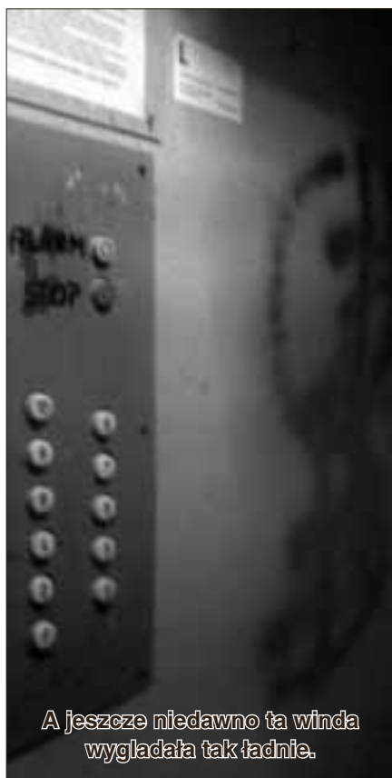
A jeszcze niedawno ta winda wyglądała tak ładnie.

zabaw, tablicy informatycznej, zniszczono ogrodzenie oraz ławki, uszkodzono urządzenia zabawowe – patrz zdjęcie str. 2.