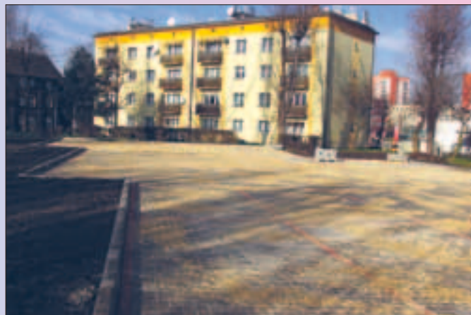
Os. „Centrum” – Nowy, pojemny parking przy ul. Kolejowej.