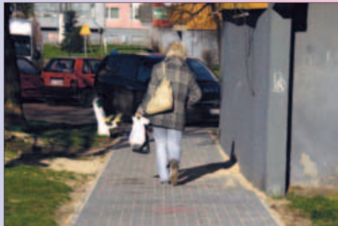
Os. „Młodych” – Po takim chodniku na pewno przyjemnie się chodzi – ul. Niepodległości 22-24 .

5. Wypiękniały klatki schodowe i piwnice w budynkach przy ul. Marii Skłodowskiej-Curie 69A-75 , bowiem za-