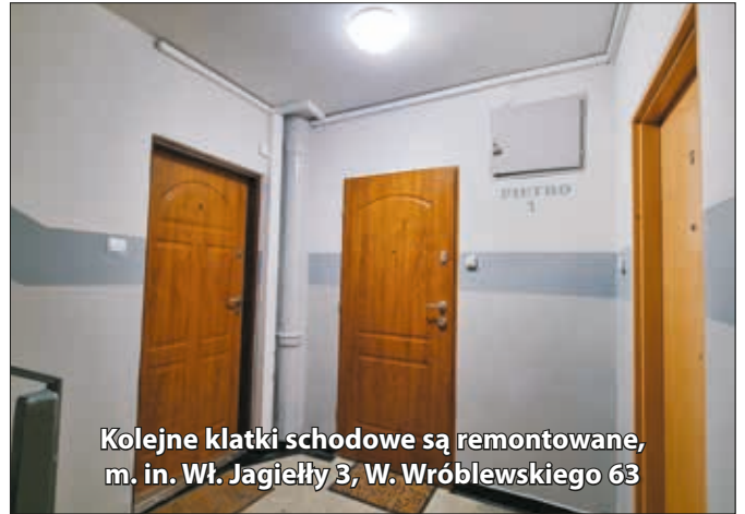
Kolejne klatki schodowe są remontowane, m. in. Wł. Jagiełły 3, W. Wróblewskiego 63

ratorów, zwiastują większe roboty malarskie na tym budynku.