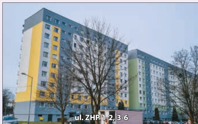
ul. ZHP 1-2, 3-6