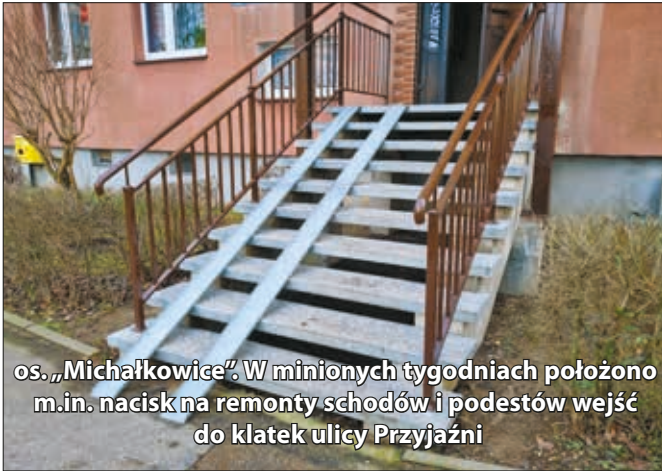
os. „Michałkowice” W minionych tygodniach położono m.in. nacisk na remonty schodów i podestów wejść do klatek ulicy Przyjaźni

Zakończono również pomiary elektryczne (skuteczności zerowania) w mieszkaniach budynków wysokich - Wyzwolenia 6, 8, 10 .