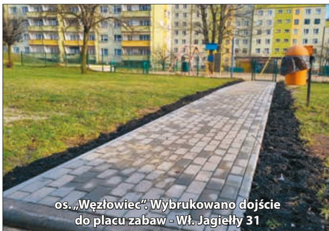
os. „Węzłowiec”. Wybrukowano dojście do placu zabaw - Wł. Jagiełły 31

Już nie wydeptana ścieżka, a porządny chodnik - pod koniec 2023 roku wybrukowano dojście do placu zabaw