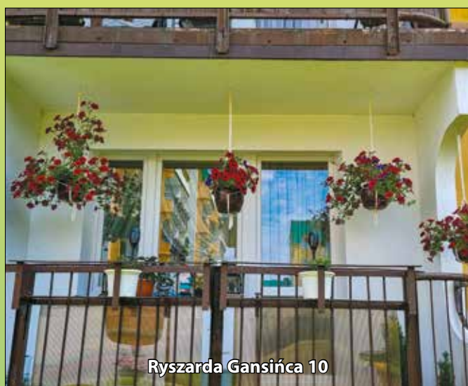
Ryszarda Gansińca 10