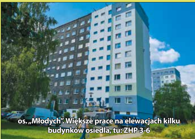
os. „Młodych”. Większe prace na elewacjach kilku budynków osiedla, tu: ZHP 3-6