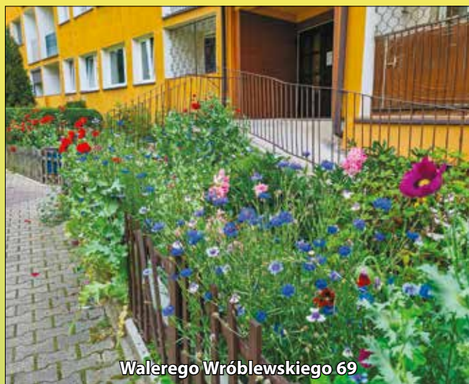
Walerego Wróblewskiego 69