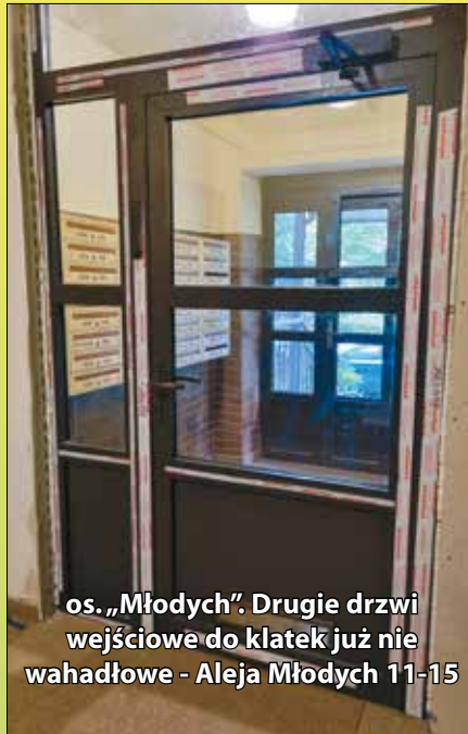
os. „Młodych”. Drugie drzwi wejściowe do klatek już nie wahadłowe - Aleja Młodych 11-15

remont drogi i parkingu w rejonie klatek schodowych przy ulicy Niepodległości 64-66 . Na ten moment zakończono pierwszy etap. Drugi - zaplanowano na dalszą część roku.