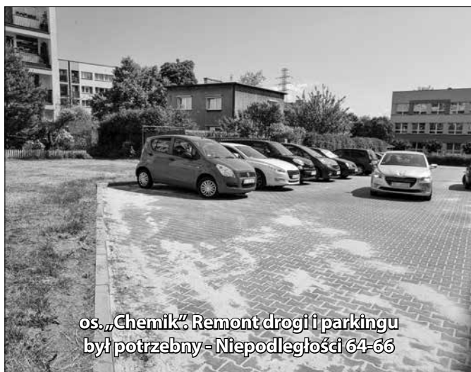
os. „Chemik”: Remont drogi i parkingu był potrzebny - Niepodległości 64-66

W budynkach przy placu Józefa Skrzeka i Pawła Wójcika 5, 6, 7