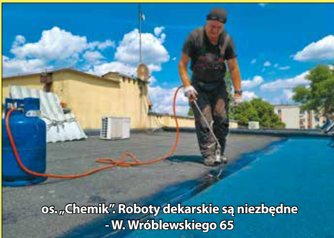
os. „Chemik”. Roboty dekarские są niezbędne - W. Wróblewskiego 65

Os. „Bańgów” Os. „Centrum” Os. „Chemik” Os. „Michałkowice” Os. „Młodych” Os. im. J. Tuwima Os. „Węzłowiec”