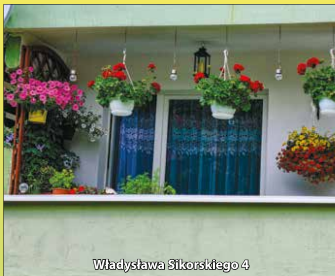
Władysława Sikorskiego 4