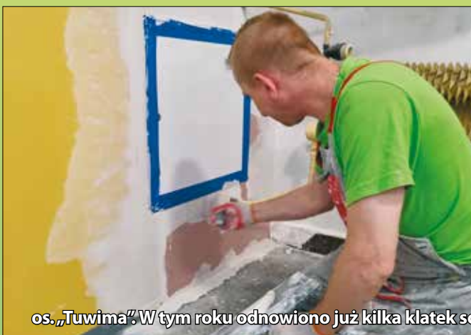
os. „Tuwima”. W tym roku odnowiono już kilka klatek schodowych, najświeższe z nich to przy W. Korfanteo 3A, B