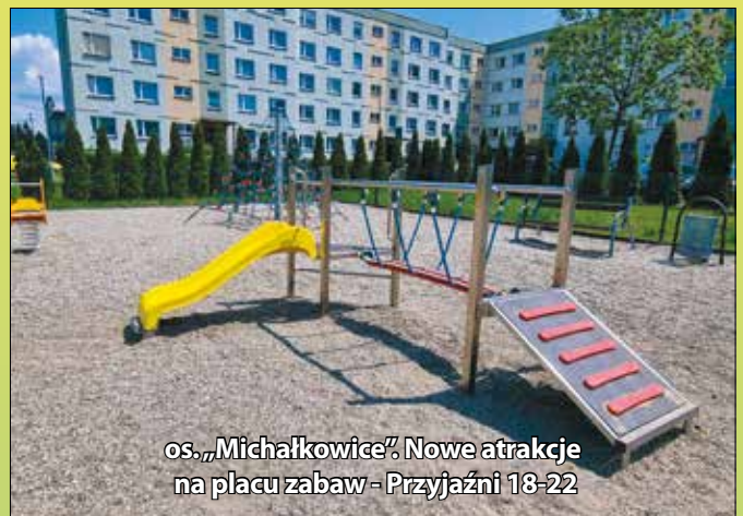
os. „Michałkowice”. Nowe atrakcje na placu zabaw - Przyjaźni 18-22