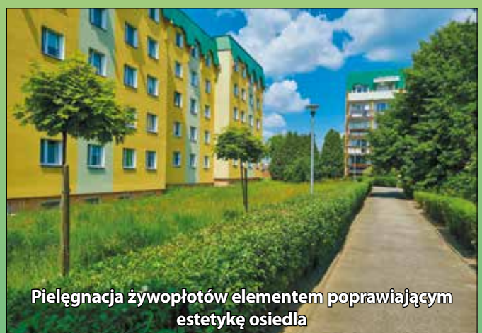
Pielęgnacja żywopłotów elementem poprawiającym estetykę osiedla