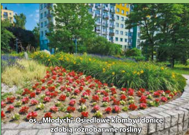
os. „Młodych”. Osiedlowe kłomby i donice zdobią różnobarwne rośliny