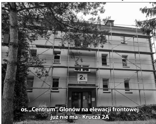
os. „Centrum”: Glonów na elewacji frontowej już nie ma - Krucza 2A

Dokończono też roboty dekarские na dachu budynku przy ulicy Wojciecha Korfańskiego 15A, B .