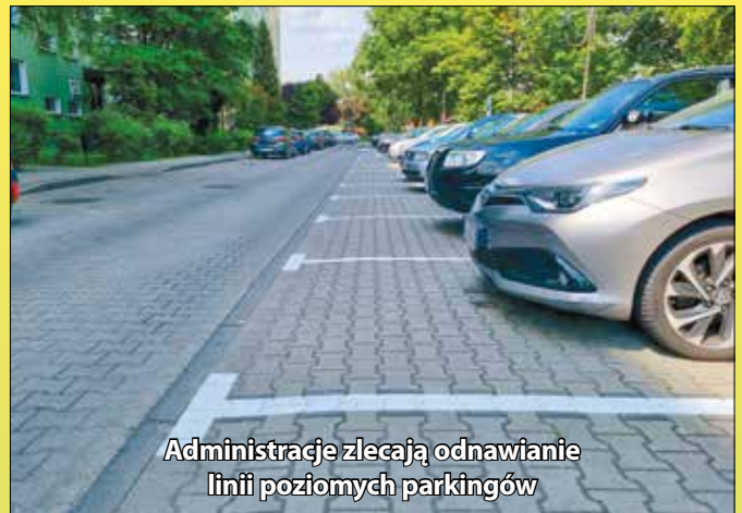
Administracje zlecają odnawianie linii poziomych parkingów