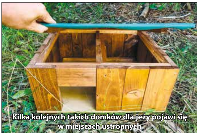
Kilka kolejnych takich domków dla jeży pojawi się w miejscach ustronnych

dadą ich fundatorem, rozdysponowano ponad 20 drewnianych domków (po 3 na każde z siedmiu osiedli SSM). W tym roku kolejne domki z przegrodą rozdysponowane zostaną w miejscach, w których mieszkańcy stale obserwu-