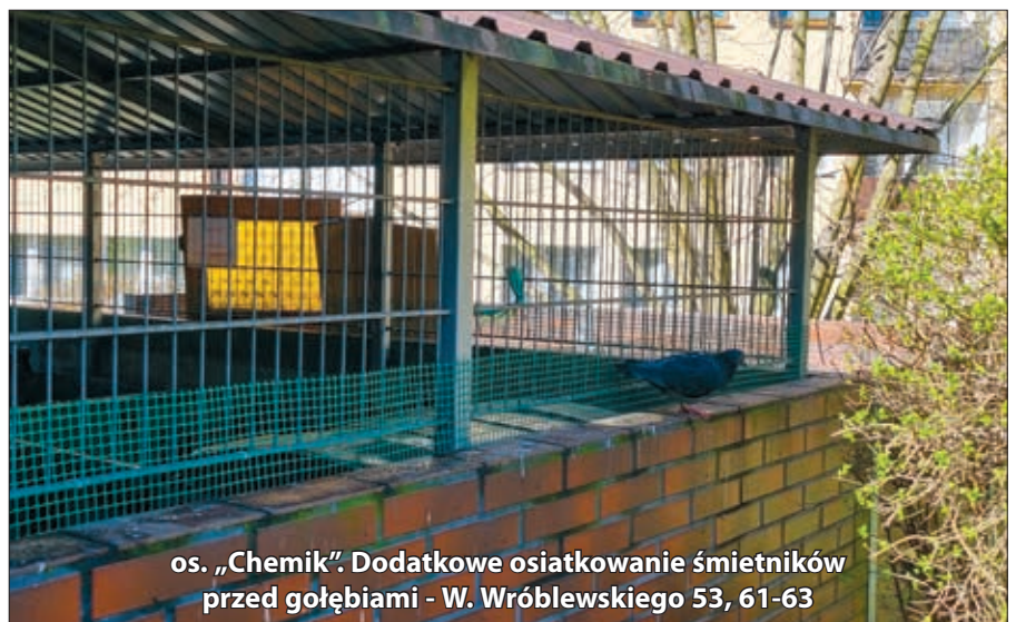
os. „Chemik”. Dodatkowe osiatkowanie śmietników przed gołębiami - W. Wróblewskiego 53, 61-63

nym głosowaniu mieszkańców największej głośności. W „Bańgowie” postawiono na kolejny etap wymiany nawierzchni