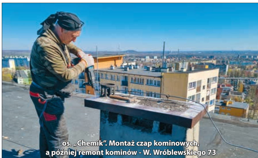
os. „Chemik”. Montaż czap kominowych, a później remont kominów - W. Wróblewskiego 73

W minionych tygodniach odnowiono kolejne klatki schodowe osiedla „Tuwima”. Zgodnie z planem przy ulicy Leśnej 7, 7A, 7B . Wzorem innych klatek w zasobach Siemianowickiej Spół-