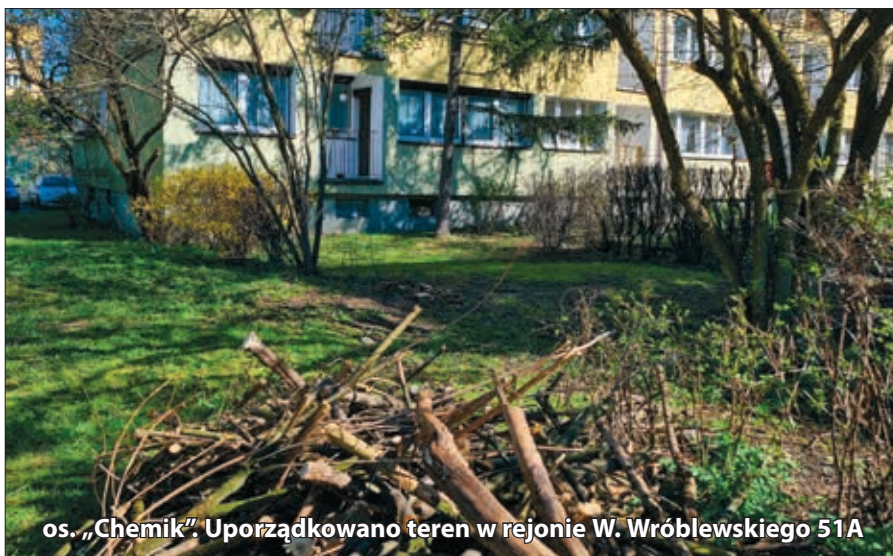
os. „Chemik”. Uporządkowano teren w rejonie W. Wróblewskiego 51A

ry do wnętrza śmietnikowej wnęki i tam podjadają - zanieczyszczając, na co zwracają często uwagę mieszkańcy, balkony i parapety okienne. Siatki poja-