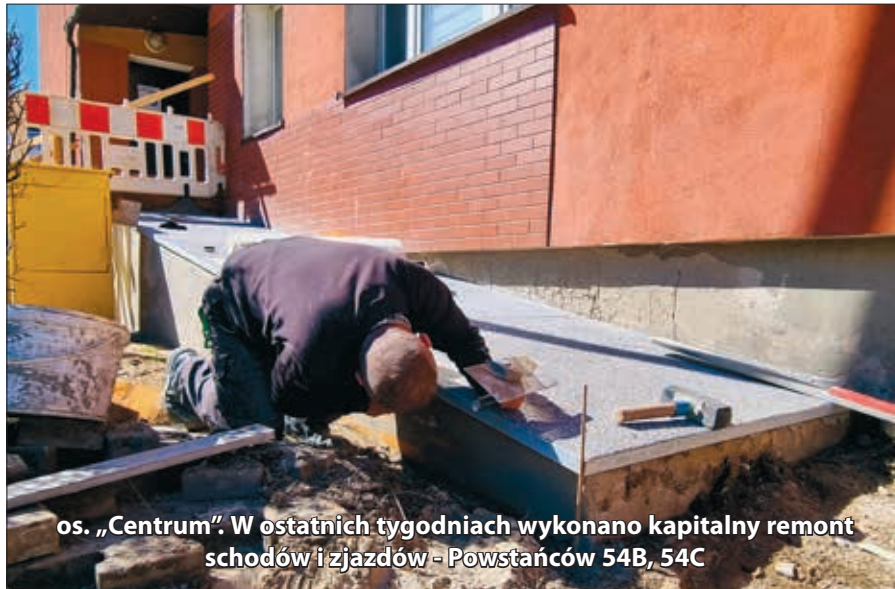
os. „Centrum”. W ostatnich tygodniach wykonano kapitalny remont schodów i zjazdów - Powstańców 54B, 54C

Z większych realizowanych na przełomie marca i kwietnia zadań, można wspomnieć o: